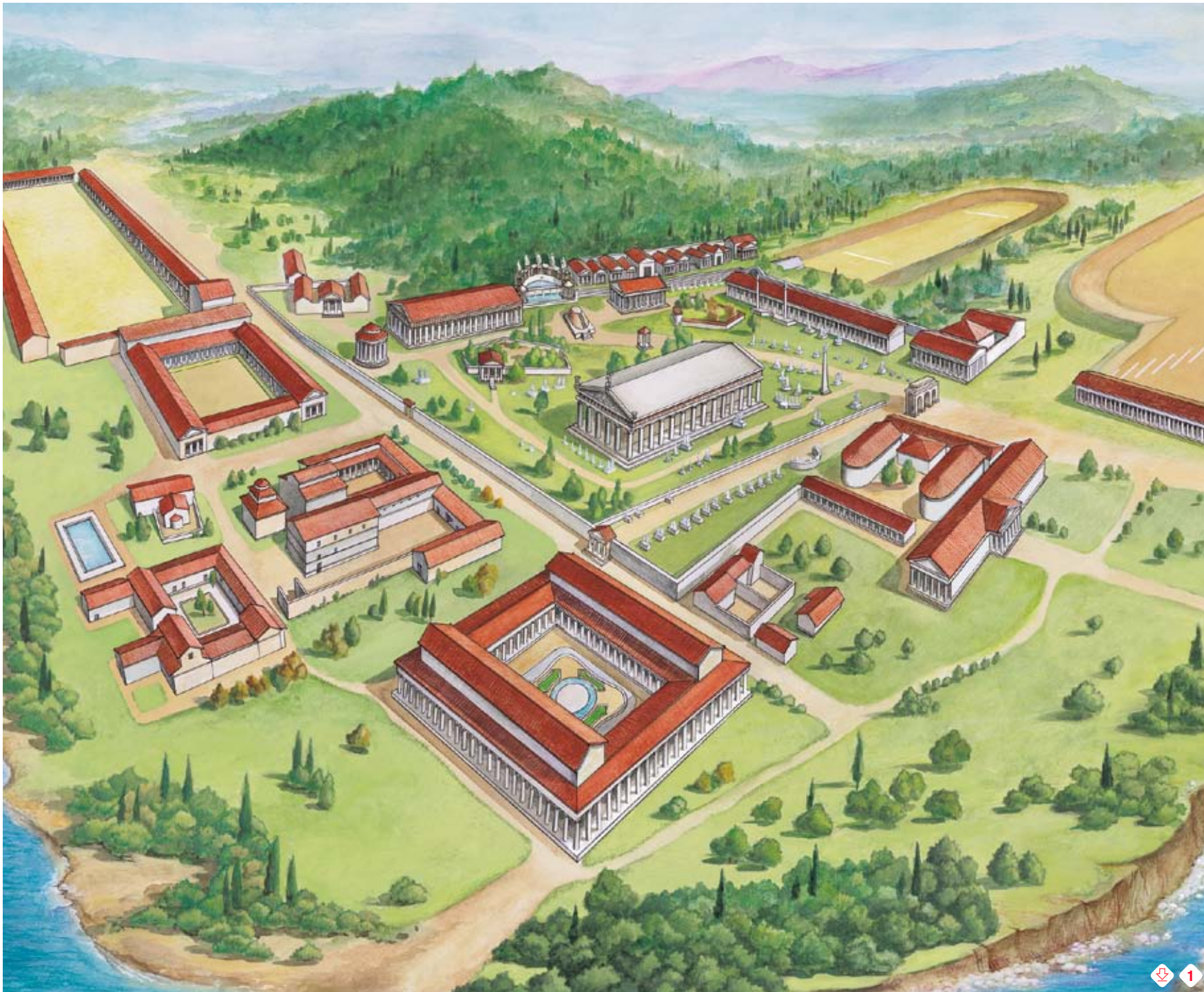
1. Rekonstruktion der Stätte von Olympia (ca. 3. Jh. v. Chr.)