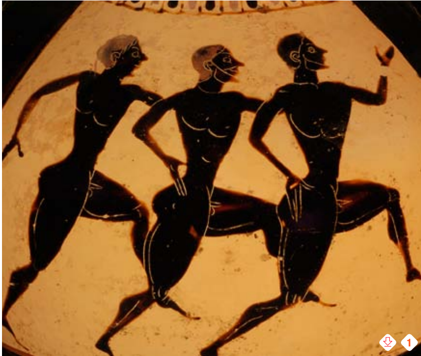
1. Darstellung des Wettlaufs

Beim Speerwurf benutzen die Athleten einen am Schaft befestigten Lederriemen, der dem Speer eine zusätzliche Rotation verleiht. Diese drei Disziplinen werden lediglich im Rahmen des Fünfkampfs ausgetragen. Wettlauf und Ringen hingegen kommen auch als Einzeldisziplinen vor.